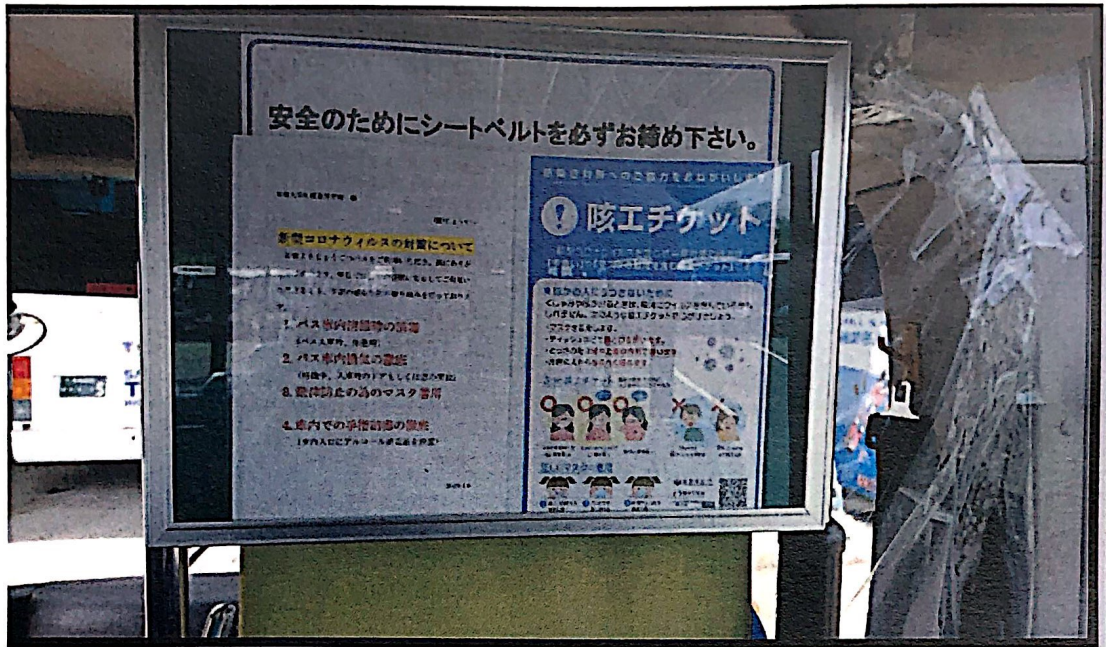
咳エチケット告知ポスターの掲示