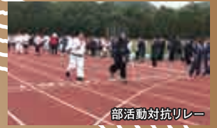
部活動対抗リレー