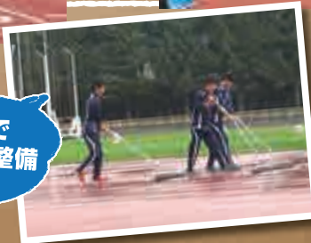
雨天でグランド整備