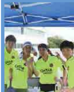
1年8組 フランケン フルト