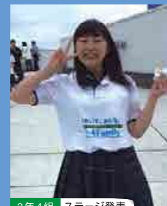
2年4組 ステージ発表