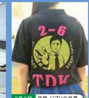
2年6組 装飾 ジブリの世界