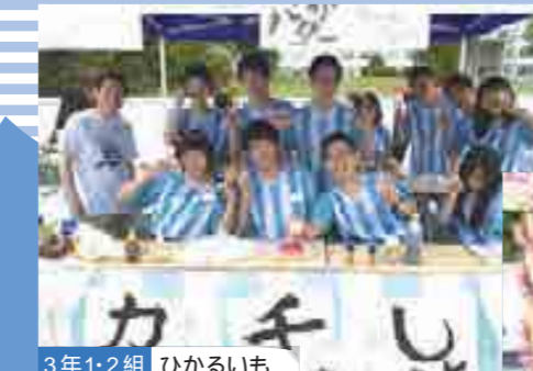
3年1・2組 ひかるいも