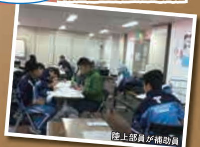
陸上部員が補助員