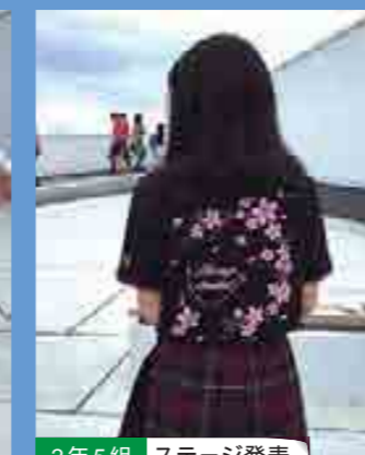
2年5組 ステージ発表