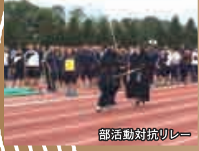
部活動対抗リレー