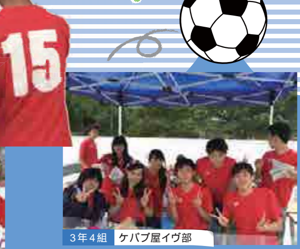
3年4組 ケバブ屋イヴ部