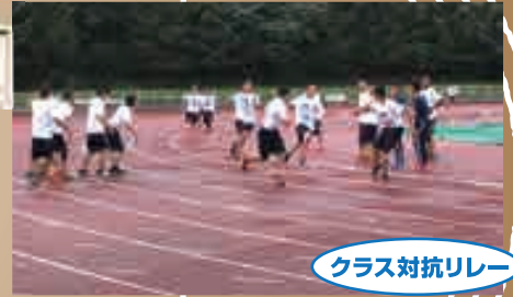
クラス対抗リレー