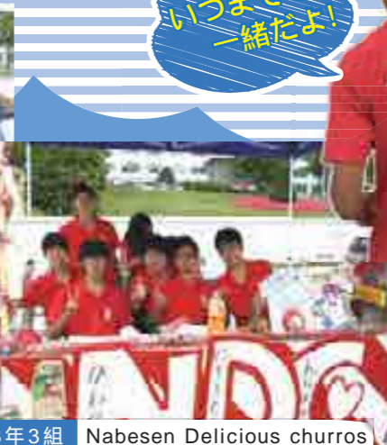
3年3組 Nabesen Delicious churros