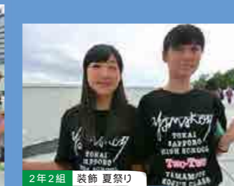
2年2組 装飾 夏祭り