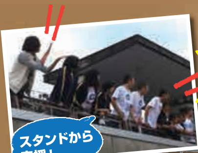
スタンドから応援!