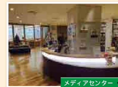
メディアセンター