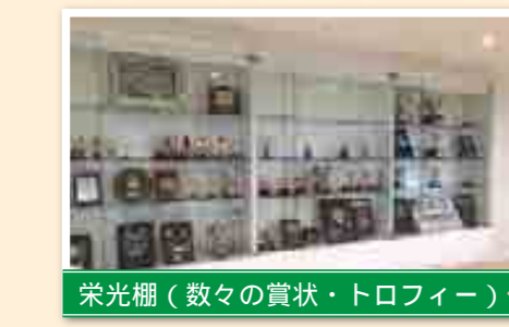
栄光棚(数々の賞状・トロフィー)