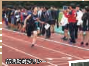
部活動対抗リレー