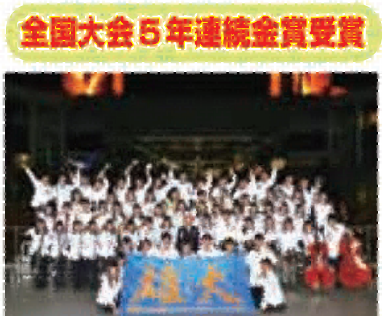
全国大会5年連続金賞受賞