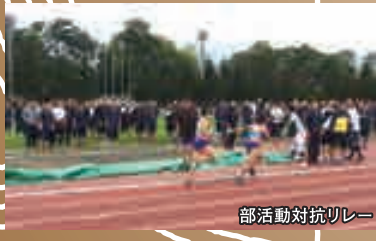
部活動対抗リレー