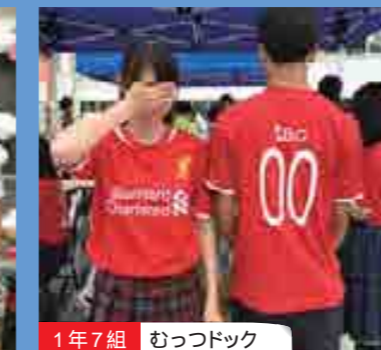
1年7組 むっつドック