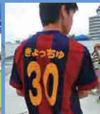
2年1組 装飾 モザイクアート