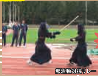
部活動対抗リレー