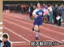
部活動対抗リレー