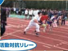
部活動対抗リレー