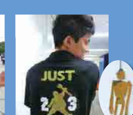
2年3組 にき氷~JUST DO EAT