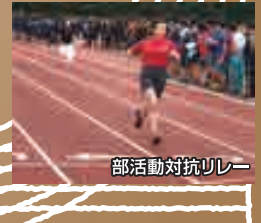
部活動対抗リレー