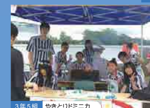
3年5組 やきとりドミニカ