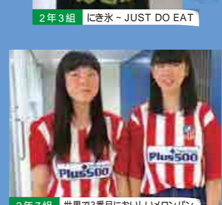
2年7組 世界で3番目にいい味のロンロン