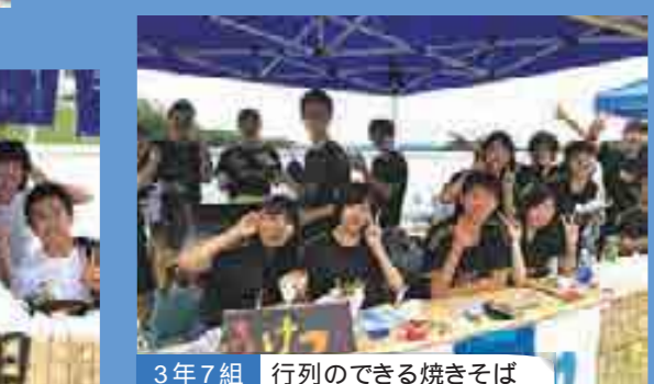
3年7組 行列のできる焼きそば