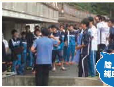
陸上部員が補助員